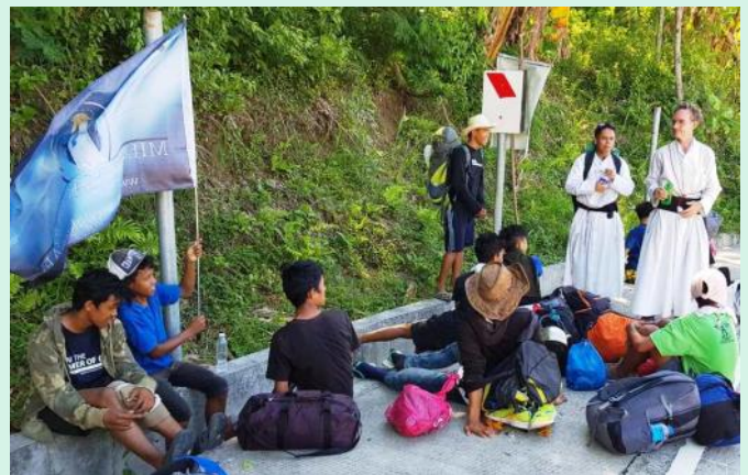
Même le chemin long et étroit comprend des moments de repos !

Mais le monde civilisé du monde entier progresse rapidement vers sa destruction. Sa restauration dans le Christ est sa seule espérance. La restauration de la virilité en Christ est une étape nécessaire. Aux Philippines, le groupe de jeunes gens de la Militia Immaculatae est une tentative de restauration. Avec plus de