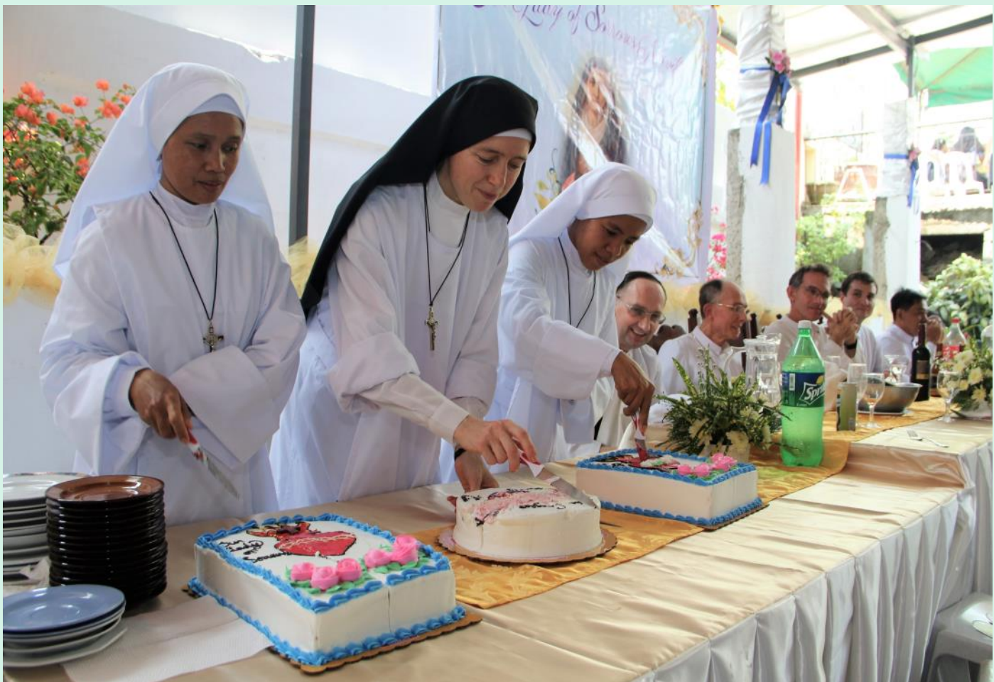
Les soeurs de cérémonie coupent le gâteau, lors de la fête.

Croix. Un an après son approbation, la communauté du Noviciat Our Lady of Sorrows se compose de deux postulantes, sept novices (dont une Chinoise et une Polonaise) et cinq sœurs oblates. Deo gratias et Mariæ !