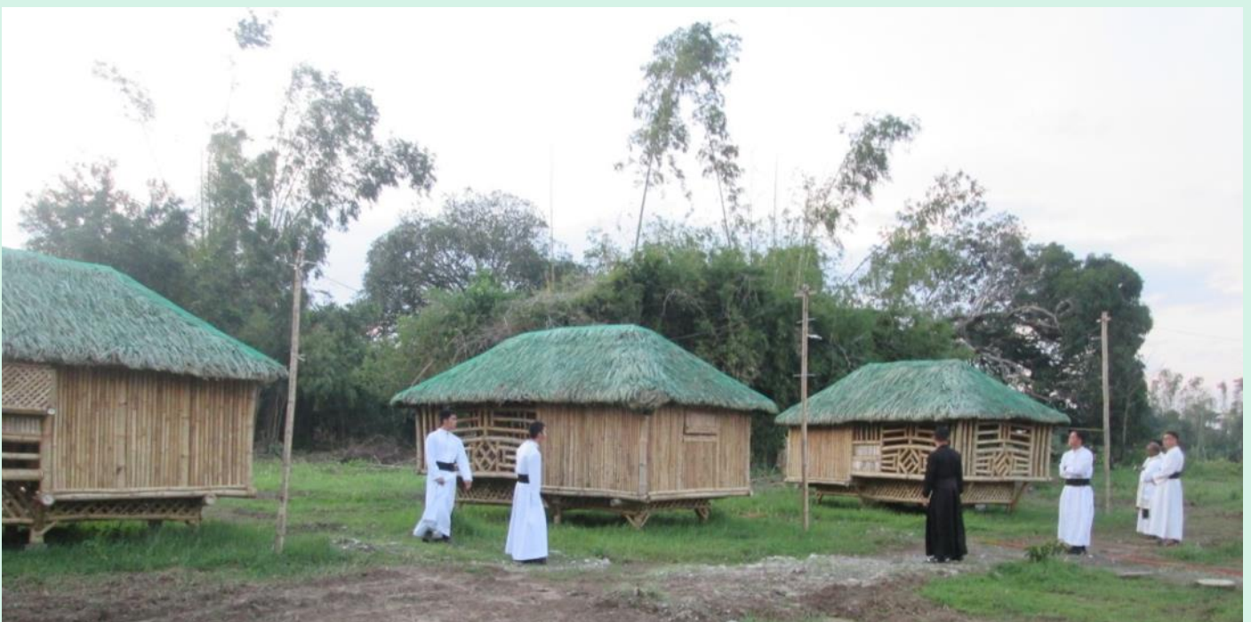
Récemment, nous avons ajouté un village Sacrada Familia ("Sainte Famille") pour visiteurs ... petites maisons de bambou avec block sanitaire.