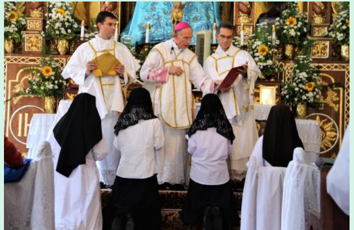
Monseigneur donne le voile béni aux 2 nouvelles novices oblates. Deo Gratias!

T ANDIS QUE la communauté des oblates se préparaient à la cérémonie avec une semaine de retraite spirituelle à la campagne, prêchée par M. l'abbé Demornex, quelques bonnes âmes se dévouaient à rénover le prieuré. Un toit était installé, car nous sommes encore dans la saison des pluies, une nouvelle peinture au sol, des plantes, des fleurs et la remise en état des bancs de l'église donnaient un aspect resplendissant au prieuré Saint-Joseph pour l'arrivée de Mgr Tissier de Mallerai.