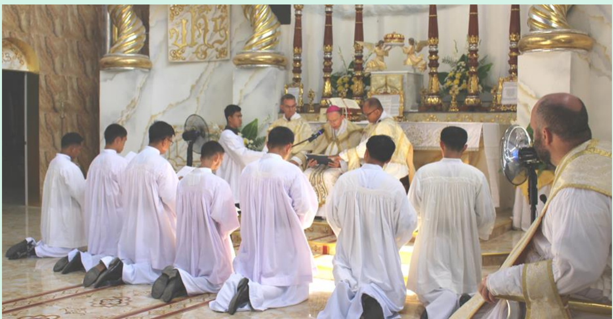
Les Frères de la Fraternité professent leurs vœux de pauvreté, chasteté et obéissance en présence de Monseigneur.