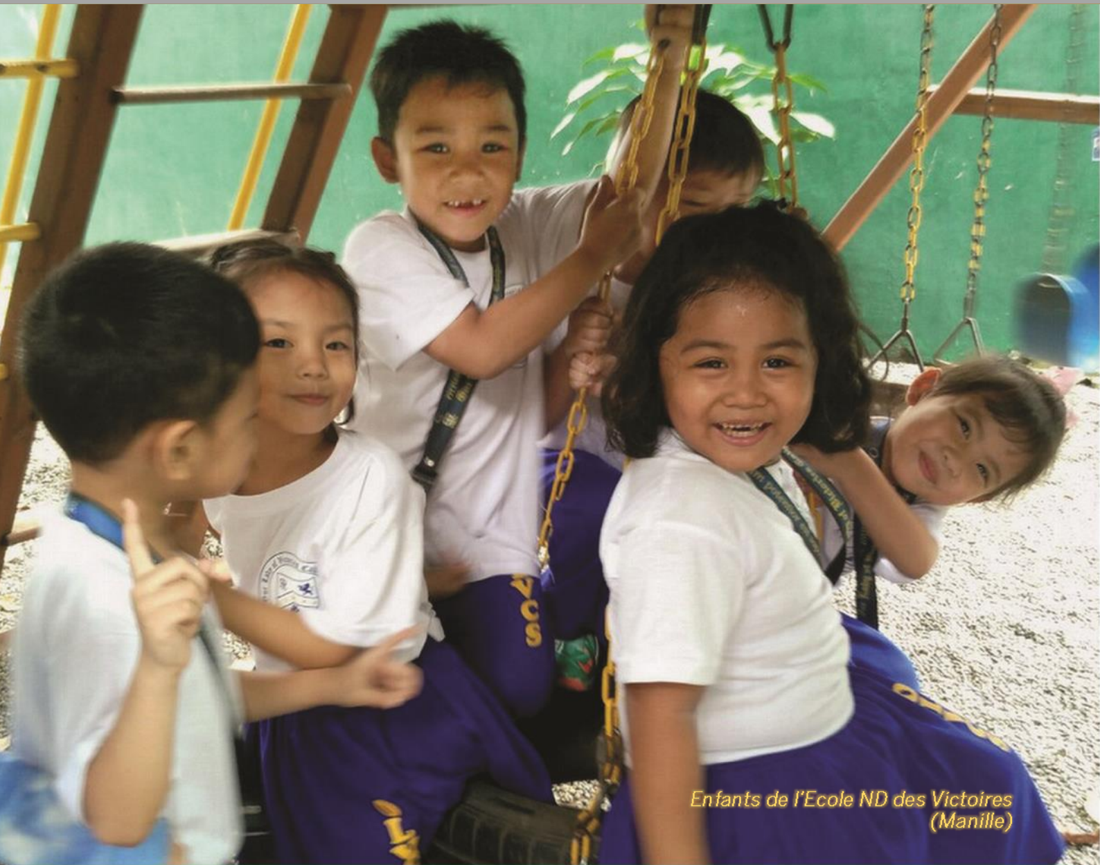
Enfants de l'Ecole ND des Victoires (Manille)