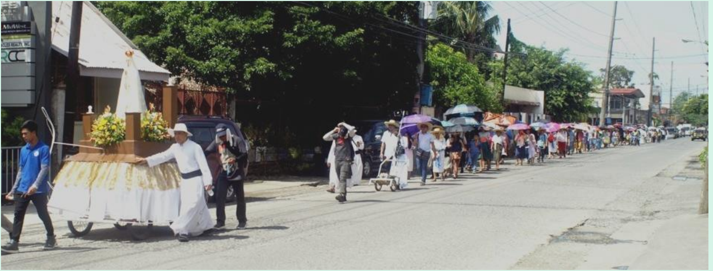
Le chemin long et étroit qui mène au Ciel !

D EPUIS 4 ans, Iloilo organise un pèlerinage de l'église Notre-Dame de Consolation de la Fraternité à Jaro, Iloilo City, à l'église du Cœur Immaculé de Marie du noviciat Saint-Bernard. Une distance de 20 km, parcourue le dimanche entre l'Assomption et le Cœur Immaculé de Marie. Avec l'intention générale de consoler notre Sainte Mère du ciel, les pèlerins commencent par le Saint Sacrifice de la Messe, puis marchent sous le soleil des Philippines, suivant le carosa de la Sainte Vierge Marie. (D'ailleurs, c'est la même statue qui a attiré tant de grâces lors du pèlerinage de 2000 km du sud au nord du pays, en 2017). A la fin, la consécration au Cœur Immaculé de Marie est renouvelée devant le Saint Sacrement. Le nombre de pèlerins, se situant régulièrement autour de 300 au cours des dernières années, a connu une légère baisse (250).