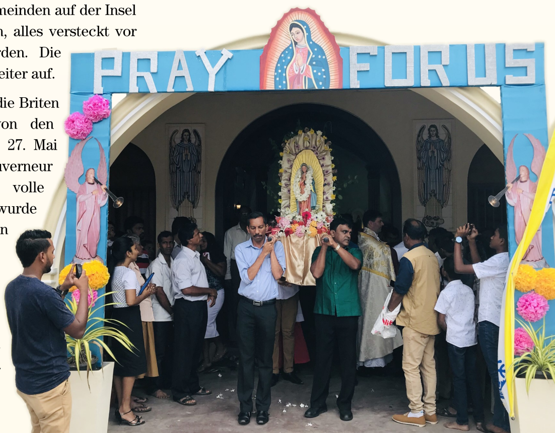
Prozession von Unserer Lieben Frau von Guadalupe in Negombo, Sri Lanka

Abgesehen von dieser sehr unglücklichen Episode genießt die katholische Kirche in Sri Lanka die Kultusfreiheit und entwickelt sich weiter, indem sie Andersgläubige bekehrt, neue Pfarreien eröffnet, Kirchen baut, neue Schulen und Ordenshäuser eröffnet. Die Kirche ist eine geschätzte Institution, die von den höchsten Behörden des Landes geachtet wird. Heute ist die katholische Kirche in 12 Diözesen aufgeteilt, und es gibt etwa 1,2 Millionen Katholiken in Sri Lanka, was laut der Volkszählung von 2012 etwa 6,1% der Gesamtbevölkerung entspricht.