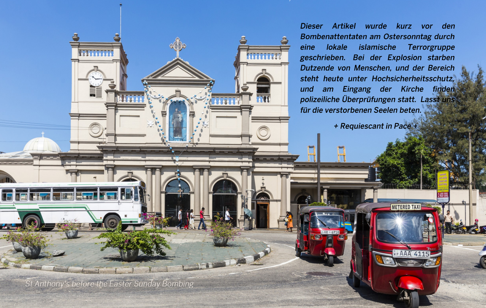
St Anthony's before the Easter Sunday Bombing