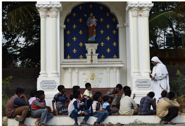
Eine Sühneschwester beim Katechismusunterricht.

Zu diesen internen Nachteilen kann man die externen hinzufügen. Verschiedene unglückliche Ereignisse trugen dazu bei, Indien vom Zentrum der katholischen Einheit zu isolieren. Es gab das Zerschneiden des (Römischen) Reiches in die römische und byzantinische Hälfte, die