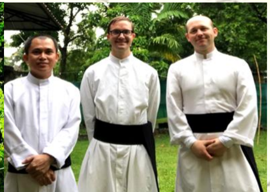
Prieuré du Sri Lanka