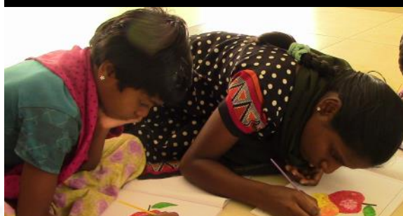
Une pomme chaque matin éloigne le médecin !