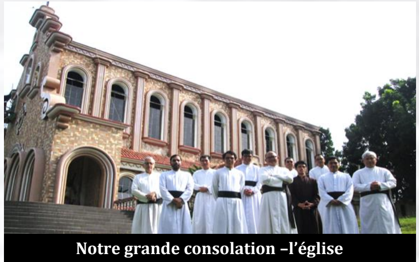
Notre grande consolation -l'église

religieuse des Frères ne soit pas perturbée, nous avons construit un "Village Santa Pamilya". Sept maisons complètes en bambou, regroupées ensemble, avec tout le confort de la vie. Elles sont situées à l'extrémité de la propriété, de sorte que ni les retraitants ni les Frères ne sont dérangés. Oui, seulement sept retraitants à la fois. Saint Ignace le prêchait à un seul à la fois !