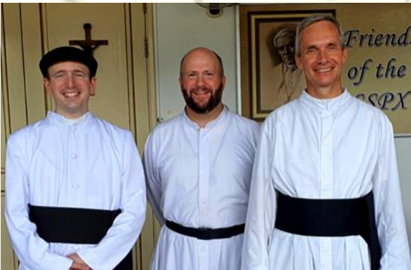
Prieuré de Singapour