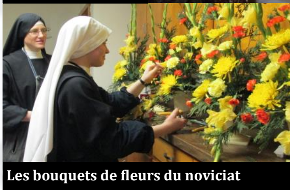
Les bouquets de fleurs du noviciat