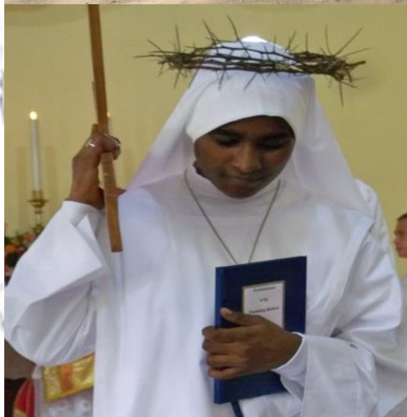
Une âme de plus qui répond à l'appel de Dieu