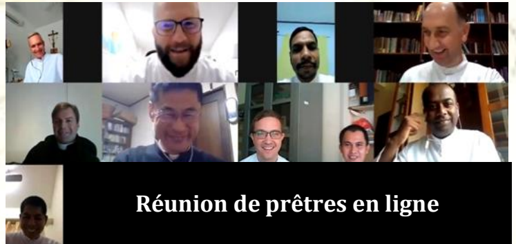
Réunion de prêtres en ligne

fois que nous nous retrouvions tous ensemble. Après beaucoup de retard, le nouveau prieuré de Tokyo a été ouvert (janvier 2021) et les confrères ont pu propager la foi dans ce pays majoritairement païen. Les confrères bloqués en France et aux Etats-Unis ont pu rejoindre leur nouvelle affectation (Singapour et Sri Lanka). Mais certains attendent encore car les frontières en