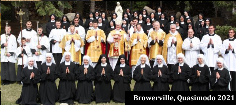
Browerville, Quasimodo 2021