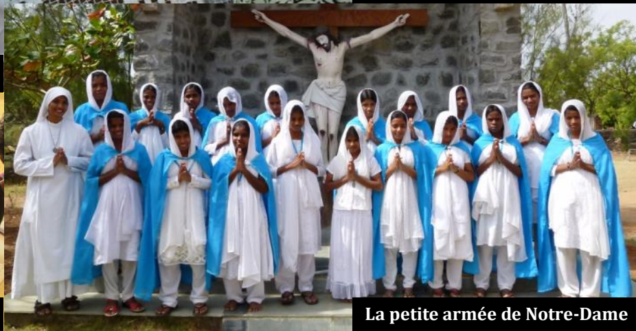
La petite armée de Notre-Dame