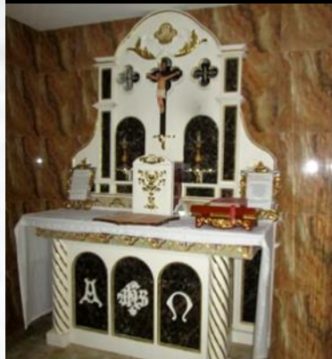
Autel de la crypte