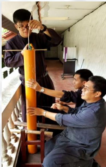
Frères d'armes coulant le cierge pascal

Entre-temps, parmi beaucoup d'autres choses, nous organisons les exercices de Saint-Ignace une fois par mois, alternativement pour les hommes et les femmes. Pour que la vie