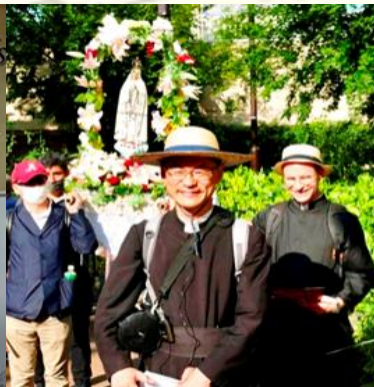
Prieuré du Japon